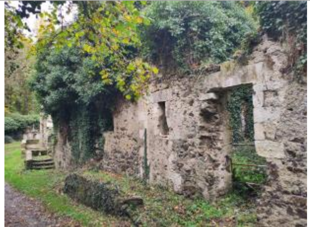
2025_vue du site

Coordonnées WGS84 : X: -1.03798990 / Y: 47.31930060