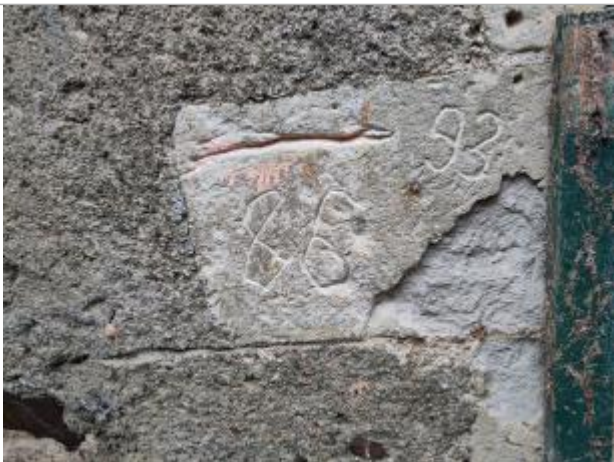
2025_vue repère 86