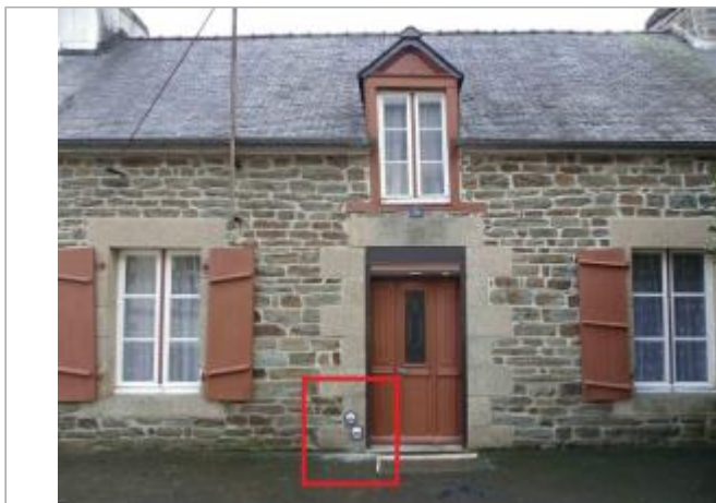
Maison au 10 rue du moulin à Saint-Samson