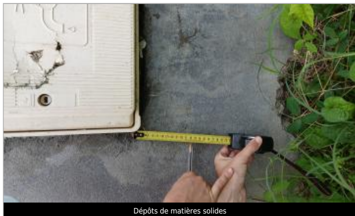
Dépôts de matières solides

Différence entre le niveau d'eau et la référence (en m) : -0.120 m