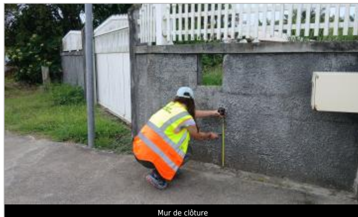
Mur de clôture

Coordonnées WGS84 : X: -61.47143050 / Y: 16.41858130