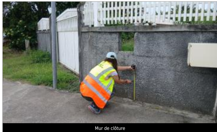
Mur de clôture