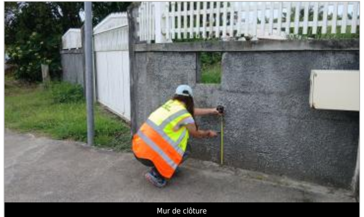
Mur de clôture