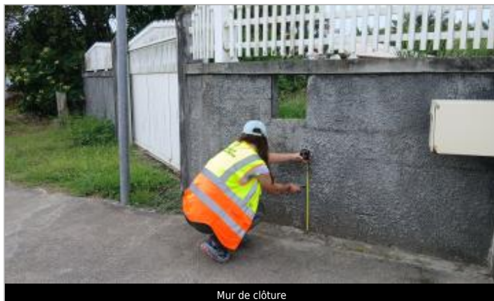
Mur de clôture

Coordonnées WGS84 : X: -61.47143050 / Y: 16.41858130