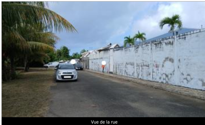
Vue de la rue