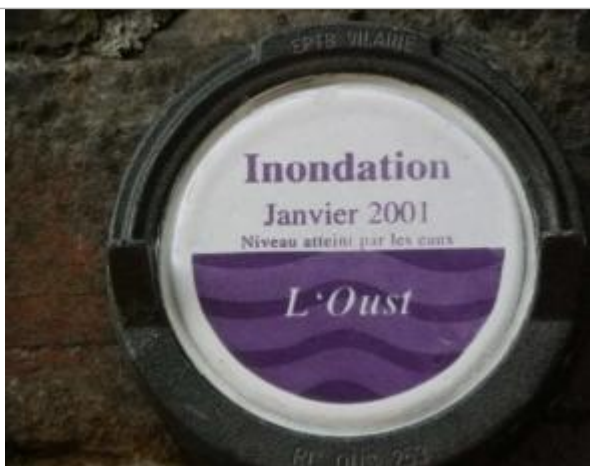
Repère normalisé sous le pont ferroviaire

Altitude calculée de l'eau (en m) : 5.86 m