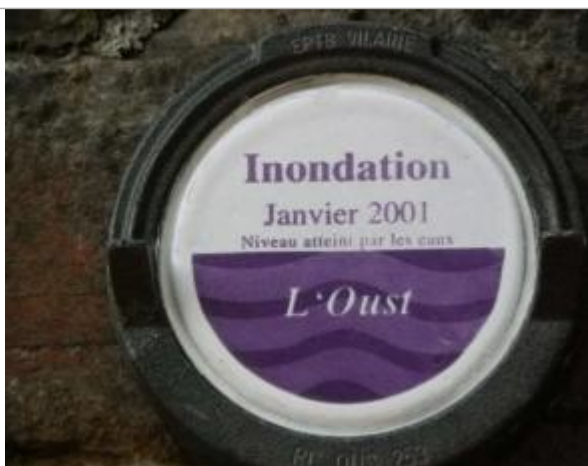
Repère normalisé sous le pont ferroviaire

Altitude calculée de l'eau (en m) : 5.86 m