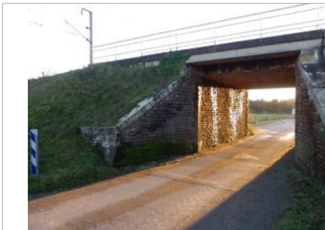
Sous le pont ferroviaire de la route longeant l'Oust