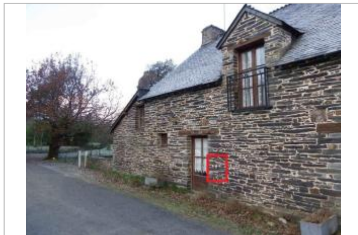
Bâtiment au moulin de la Née