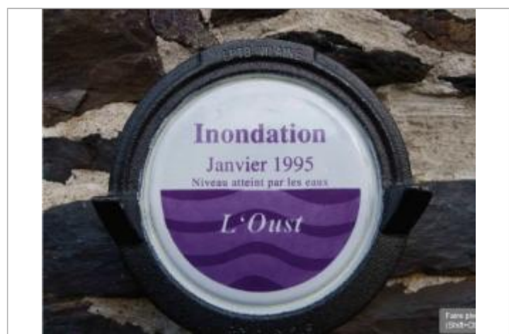
Repère normalisé sur le coté de la porte du bâtiment (disparu en avril 2025)