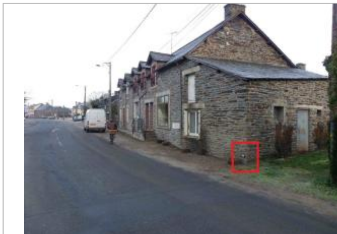
mur de l'annexe de la maison au n°26 rue du Guélin