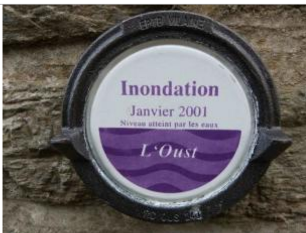
Repère normalisé sur le mur de l'annexe de la maison

Altitude calculée de l'eau (en m) : 8.06