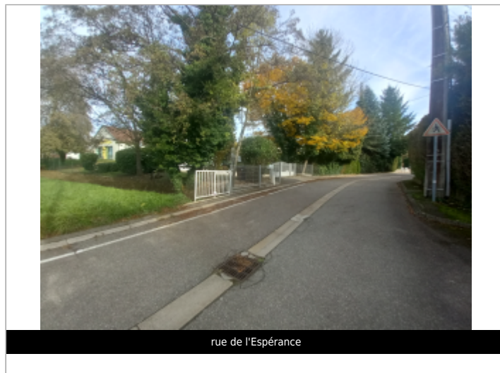
rue de l'Espérance