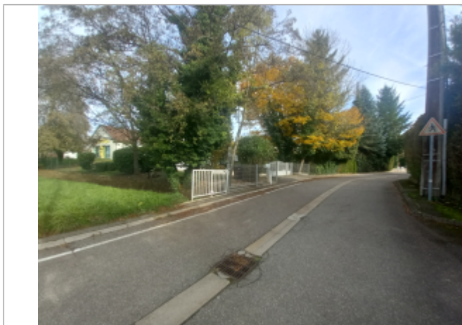
rue de l'Espérance