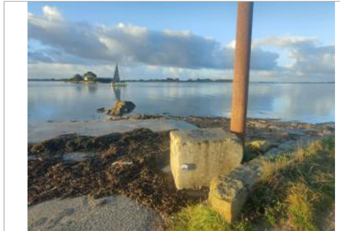
Le passage de Saint-Armel - Séné