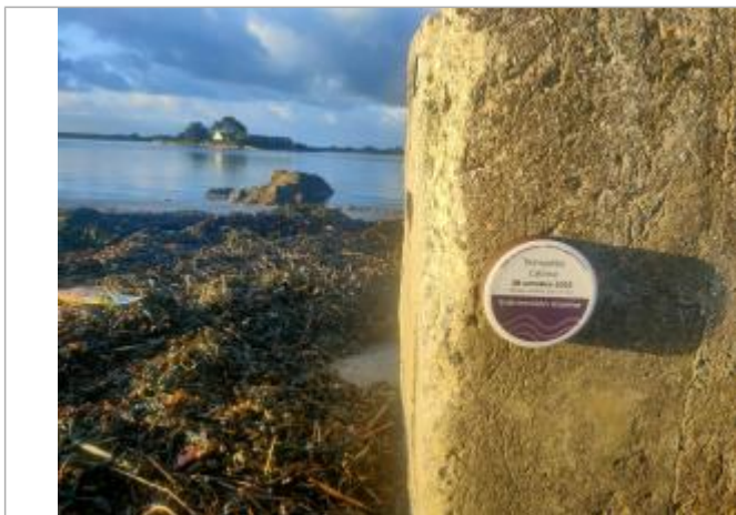
Le passage de Saint-Armel - Séné