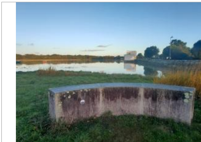
Impasse de la baie - Cantizac - Séné