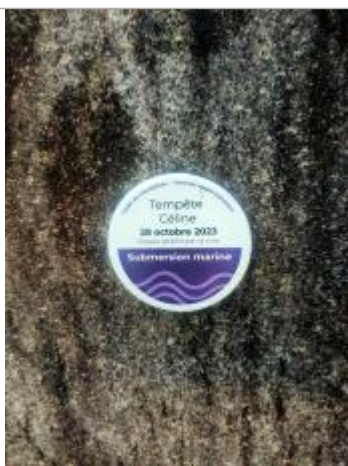
Cantizac - Séné

Système altimétrique : NGF IGN 1969 (système normal)