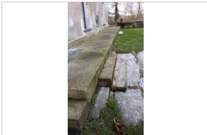
Marches à l'entrée du moulin de Beaujouet le 05/02/2025

Coordonnées WGS84 : X: -1.62049833 / Y: 47.60184410