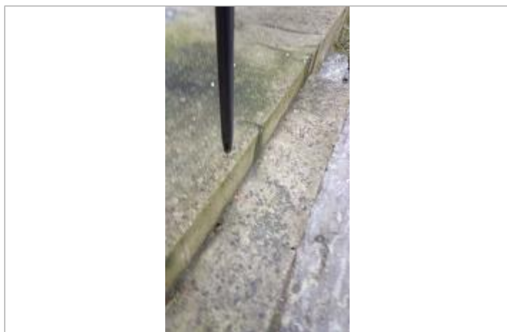
Relevé de la laisse d'inondation sur les marches le 05/02/2025