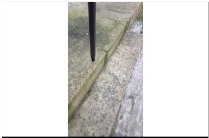
Relevé de la laisse d'inondation sur les marches le 05/02/2025

GÉNÉRAL Code : SPC_44113_01_2025 Date de mise à jour : 24/10/2025 Auteur : SPC VCB