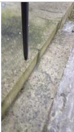
Relevé de la laisse d'inondation sur les marches le 05/02/2025

Altitude calculée de l'eau (en m) : 16.701