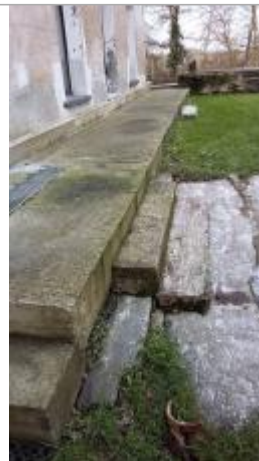
Marches à l'entrée du moulin de Beaujouet le 05/02/2025