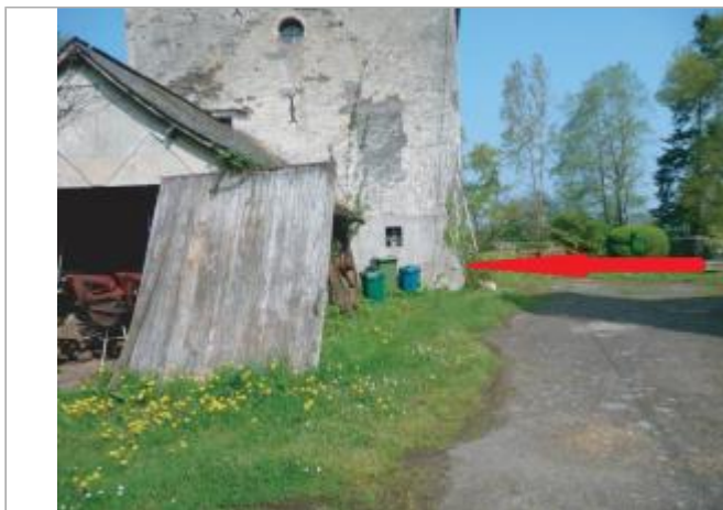
angle du bâtiment du moulin de Beaujouet

Coordonnées WGS84 : X: -1.62048990 / Y: 47.60173810