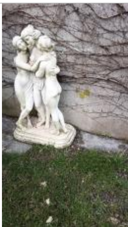
Témoignage du niveau de l'inondation sur les statues le 05/02/2025