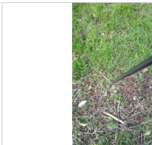
Relevé de la laisse d'inondation sur la prairie le 05/02/2025