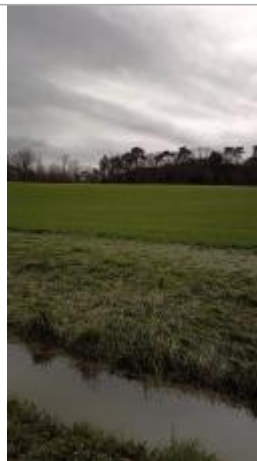
champ près de la route du moulin des Piles le 05/02/2025