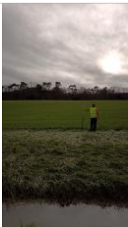
Relevé de la laisse d'inondation dans le champ le 05/02/2025

Altitude calculée de l'eau (en m) : 11.802