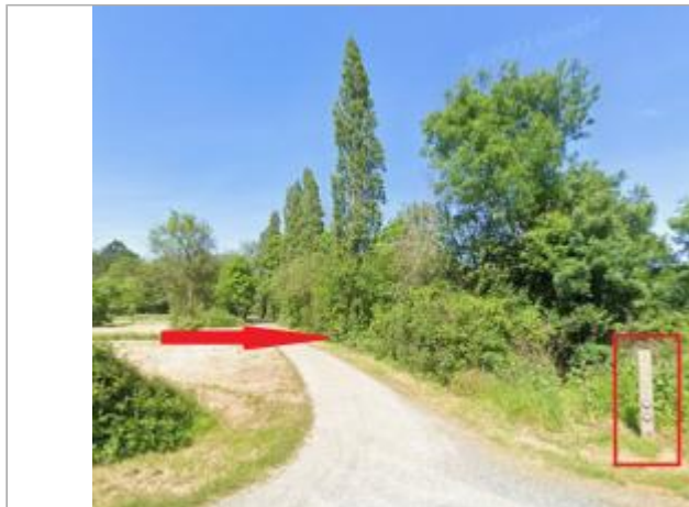
Bord du chemin d'accès au Don à partir de la RD 125

Coordonnées WGS84 : X: -1.82892396 / Y: 47.62543740