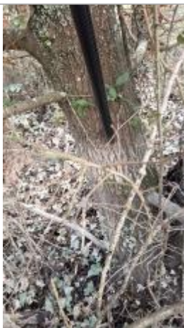
Relevé de la laisse d'inondation sur le tronç du peuplier le 05/02/2025