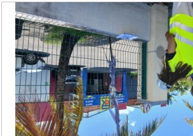
Entrée magasin grossiste