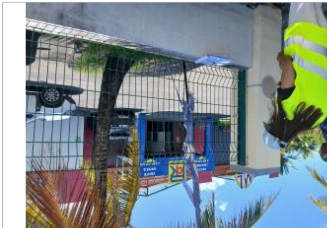
Entrée magasin grossiste