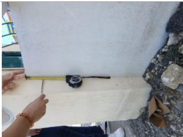
témoignage d'une hauteur d'eau

Différence entre le niveau d'eau et la référence (en m) : -0.080 m