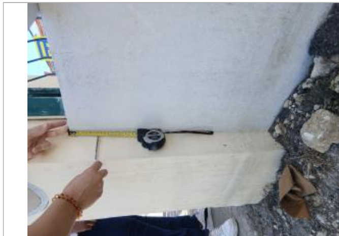
témoignage d'une hauteur d'eau

Différence entre le niveau d'eau et la référence (en m) : -0.080 m