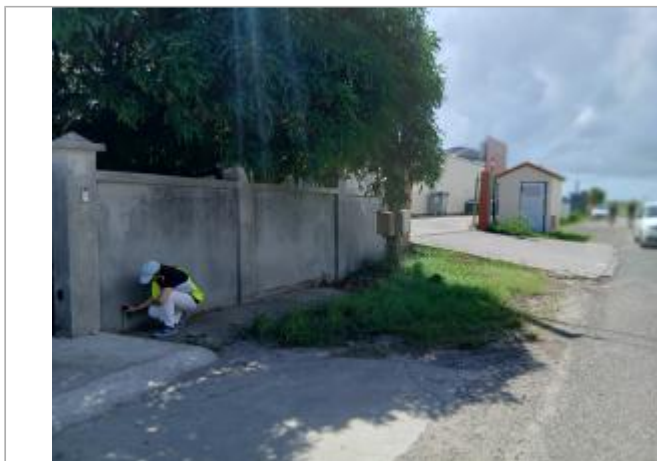
Mur de clôture