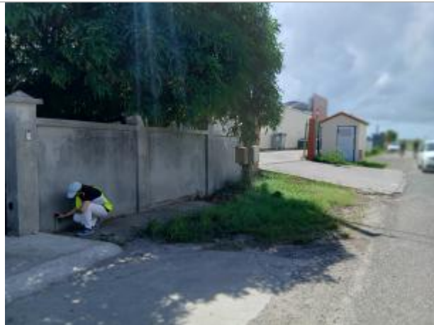
Mur de clôture