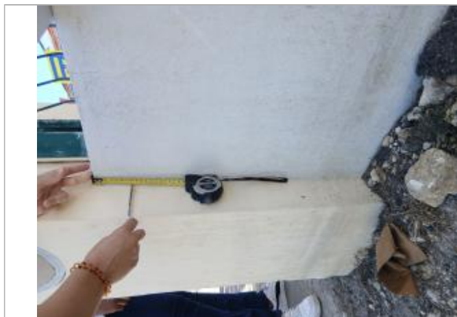
témoignage d'une hauteur d'eau

Différence entre le niveau d'eau et la référence (en m) : -0.080 m