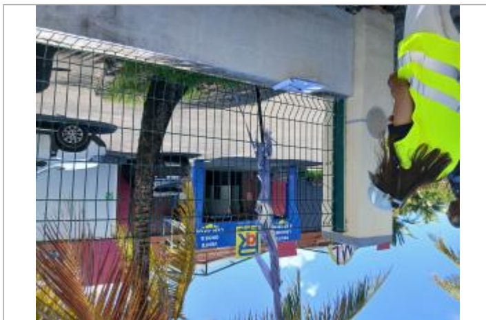
Entrée magasin grossiste