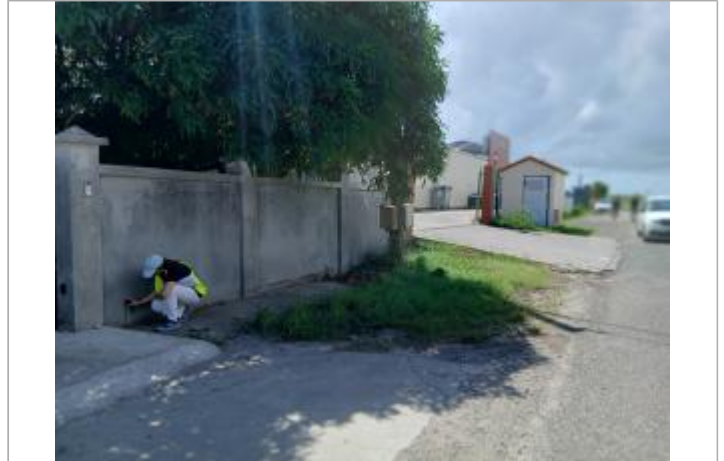
Mur de clôture