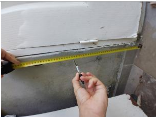
Dépôts de matières solides à gauche de la porte

Différence entre le niveau d'eau et la référence (en m) : 0.330 m