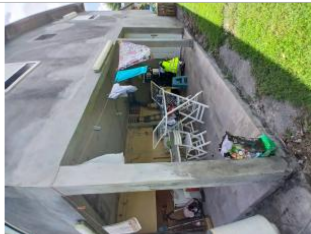
Terrasse côté ravine Cayenne

Coordonnées RGF93 (ETRS89) : X: -61.286434 / Y: 16.2628854