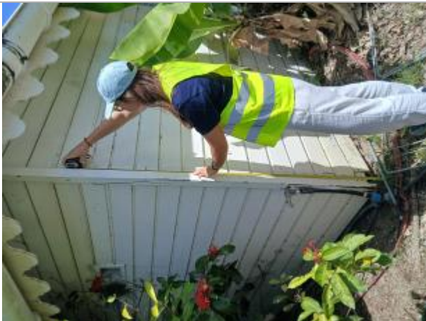
Mesurée prise depuis le bas du cabanon

Différence entre le niveau d'eau et la référence (en m) : 1.760 m