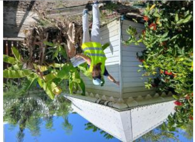
Cabanon en bois, façade côté portail