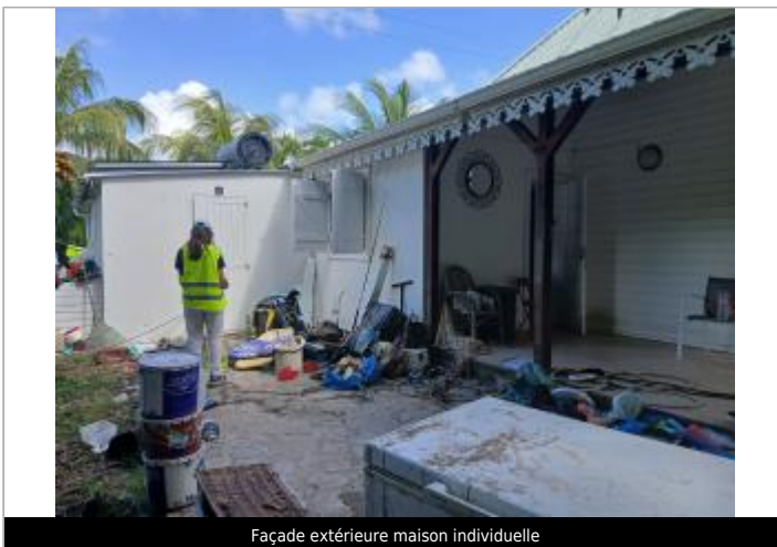
Façade extérieure maison individuelle