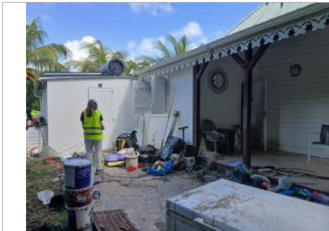
Façade extérieure maison individuelle

Coordonnées WGS84 : X: -61.29861980 / Y: 16.25918890