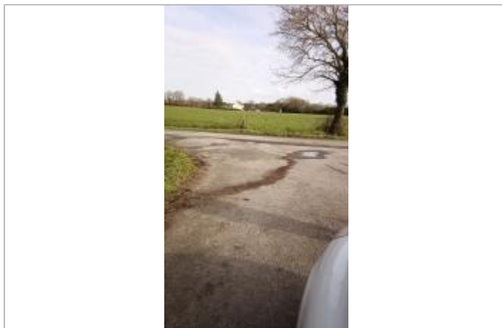
A l'intersection des routes de Balleron et la Basse Tremblais le 05/02/2025

Coordonnées WGS84 : X: -1.85501125 / Y: 47.62510730