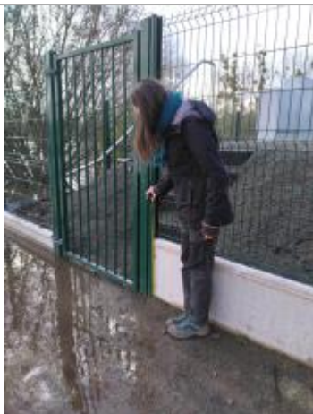
Dépôt de sédiments/végétation sur le muret. Mesure collée à la limite droite de la porte.

DGPS. RÉFÉRENCE NIVELÉE : SOL, AU PIED DU MUR (SITE). LC MESURÉE À 32,5 CM DU SOL. - 03/02/2025