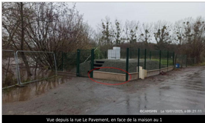
Vue depuis la rue Le Pavement, en face de la maison au 1

Coordonnées WGS84 : X: -1.29806503 / Y: 48.61845100