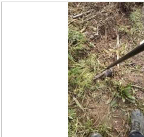
Relevé de la laisse d'inondation sur le bord du chemin le 05/02/2025