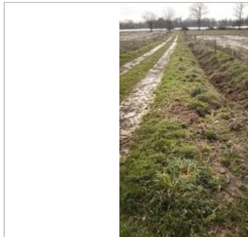
Bord du chemin d'exploitation vers Port Jarnier le 05/02/2025

Coordonnées WGS84 : X: -1.87164269 / Y: 47.63435540