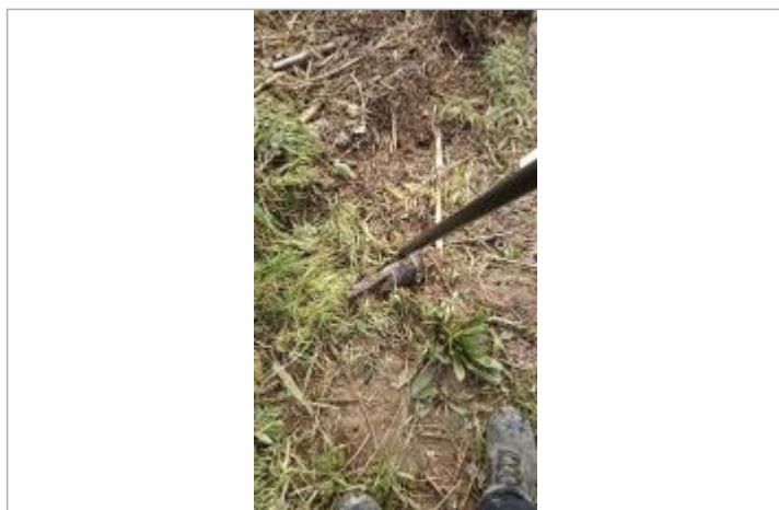
Relevé de la laisse d'inondation sur le bord du chemin le 05/02/2025