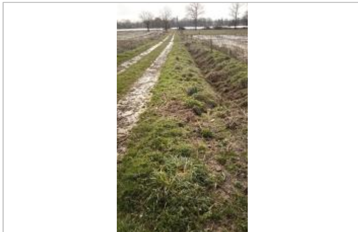
Bord du chemin d'exploitation vers Port Jarnier le 05/02/2025

Coordonnées WGS84 : X: -1.87164269 / Y: 47.63435540