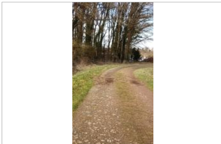
chemin Réages des Pièces Vertes à Massérac le 05/02/2025

Coordonnées WGS84 : X: -1.92856735 / Y: 47.66712010