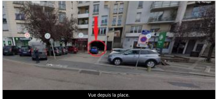
Vue depuis la place.