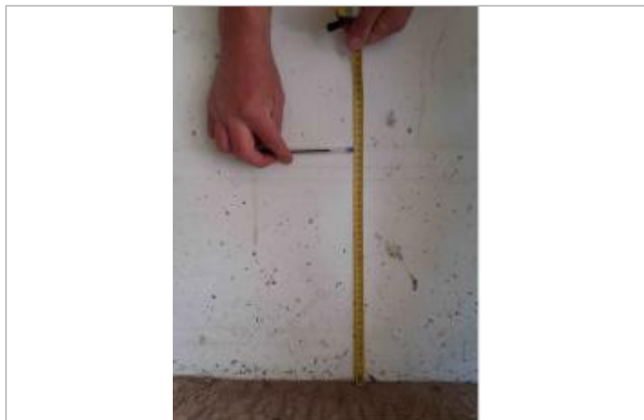
Laisse de crue à 36 cm/sol.