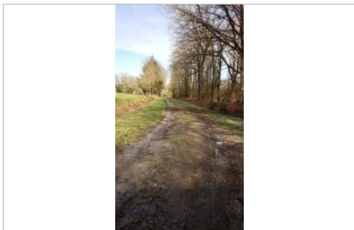
Laisse d'inondation sur le chemin