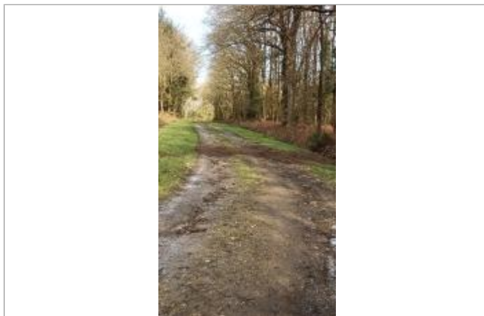
Chemin de port Roland à Massérac le 05/02/2025

Coordonnées WGS84 : X: -1.91699400 / Y: 47.66228980