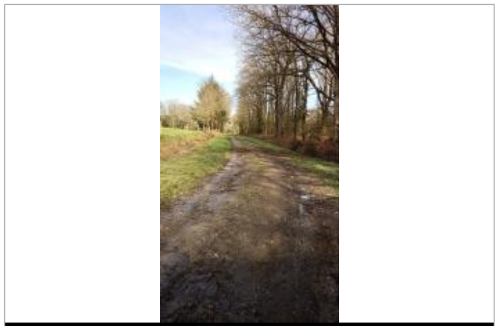
Laisse d'inondation sur le chemin

GÉNÉRAL Code : SPC_44092_01_2025 Date de mise à jour : 22/10/2025 Auteur : SPC VCB