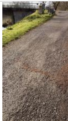
Sur le chemin de halage en face du port de Beslé coté Langon le 05/02/2025