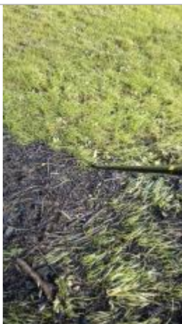
Relevé de la laisse d'inondation dans le champ le 05/02/2025

Altitude calculée de l'eau (en m) : 20.015 m