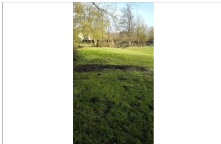
Champ entre la Chère et la RD 44 le 05/02/2025

Coordonnées WGS84 : X: -1.64350923 / Y: 47.69455640