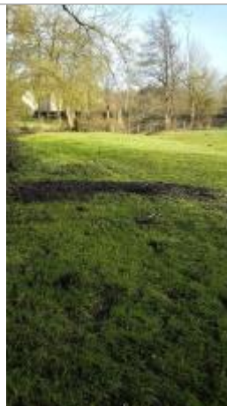
Champ entre la Chère et la RD 44 le 05/02/2025