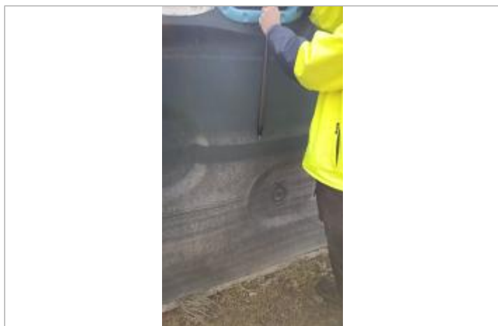
Relevé de la laisse d'inondation sur une poubelle le 05/02/2025

Maximum de l'inondation : Oui Visibilité : Non État du repère : Disparu Pérennité : Aucune Repère calculé : Non PHEC : Non