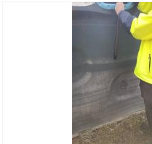
Relevé de la laisse d'inondation sur une poubelle le 05/02/2025 - photo SPC MLA