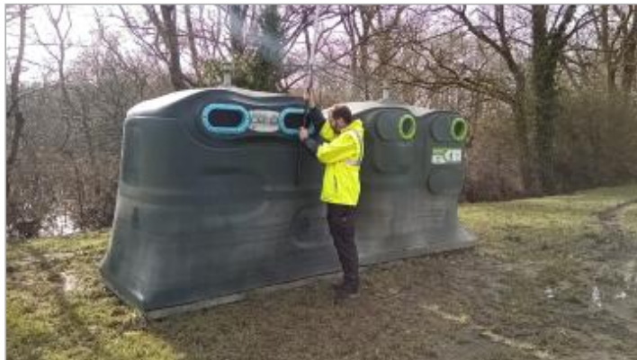
Conteneurs poubelles au fond du parking le 05/02/2025

Coordonnées WGS84 : X: -2.04548794 / Y: 47.57091820