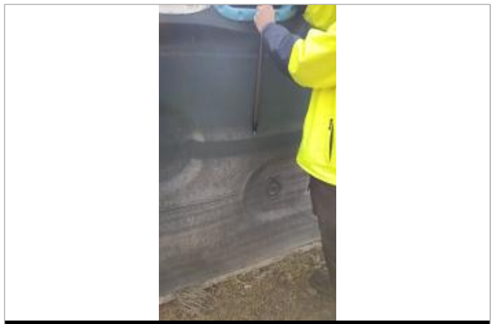
Relevé de la laisse d'inondation sur une poubelle le 05/02/2025

GÉNÉRAL Code : SPC_44057_07_2025 Date de mise à jour : 22/10/2025 Auteur : SPC VCB