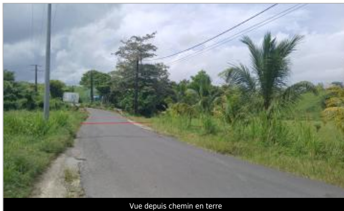
Vue depuis chemin en terre