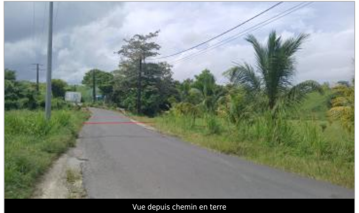
Vue depuis chemin en terre