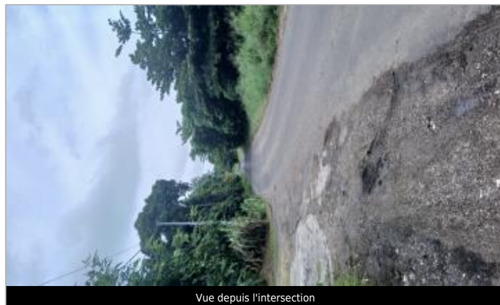
Vue depuis l'intersection