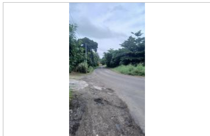
Limite emprise de zone inondée (rouge)