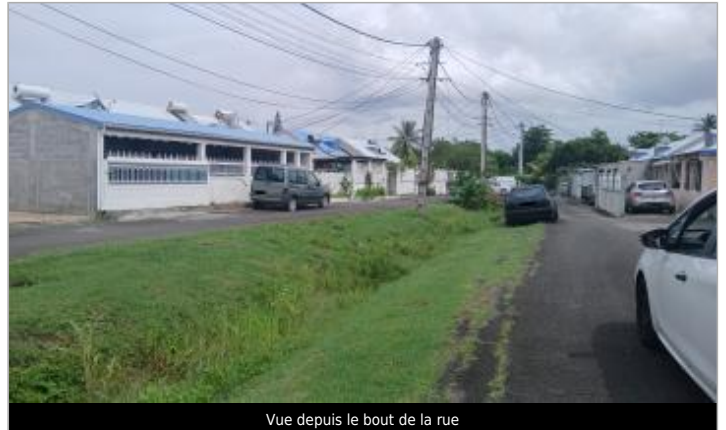
Vue depuis le bout de la rue