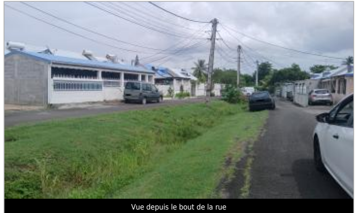
Vue depuis le bout de la rue