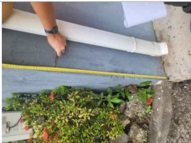
Témoignage d'une hauteur d'eau

Différence entre le niveau d'eau et la référence (en m) : 0.800 m