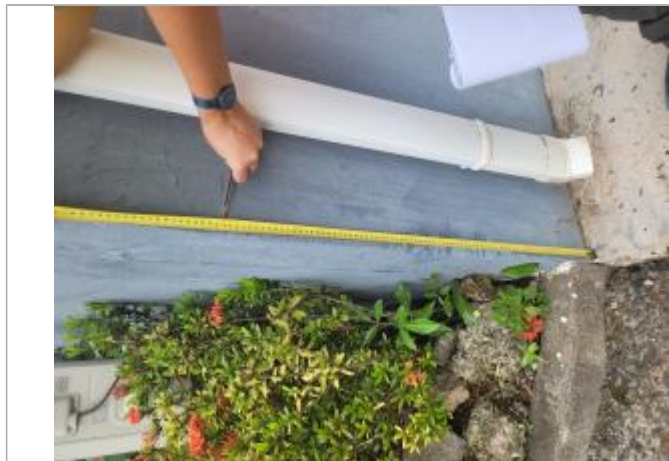
Témoignage d'une hauteur d'eau

Différence entre le niveau d'eau et la référence (en m) : 0.800 m