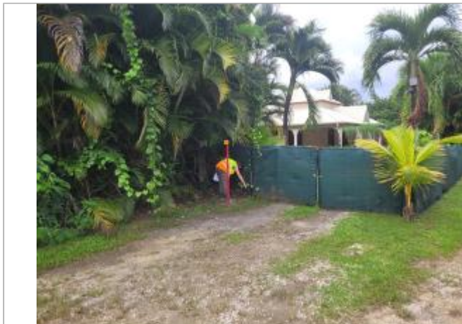
Vue depuis la RN

Coordonnées WGS84 : X: -61.46888000 / Y: 16.32542820