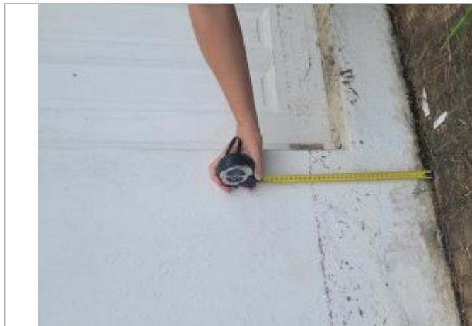
Dépôts de matière solides

Différence entre le niveau d'eau et la référence (en m) : 0.280 m