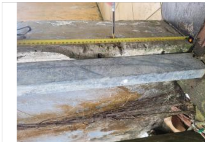
Témoignage d'une hauteur d'eau

Différence entre le niveau d'eau et la référence (en m) : 0.250 m