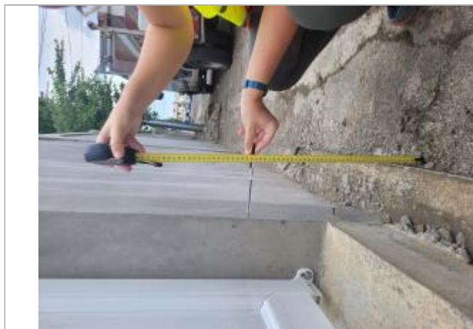
Dépôts de matières solides

Différence entre le niveau d'eau et la référence (en m) : 0.410 m