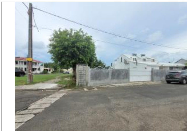
Vue sur maison individuelle depuis la rue Jean Jaurès

Coordonnées WGS84 : X: -61.45987940 / Y: 16.33424510