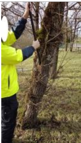
Relevé de la laisse d'inondation sur un tronc

Altitude calculée de l'eau (en m) : 4.671 m