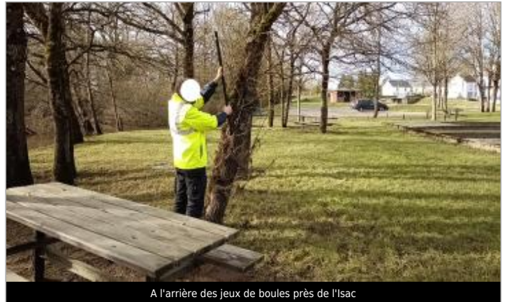
A l'arrière des jeux de boules près de l'Isac

Coordonnées WGS84 : X: -2.04504717 / Y: 47.57084030