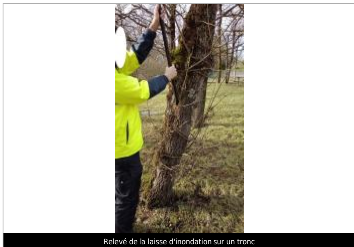
Relevé de la laisse d'inondation sur un tronc

Altitude calculée de l'eau (en m) : 4.671 m