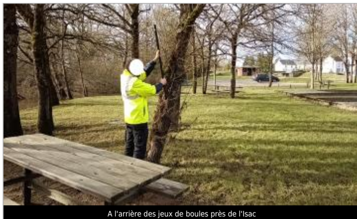
A l'arrière des jeux de boules près de l'Isac