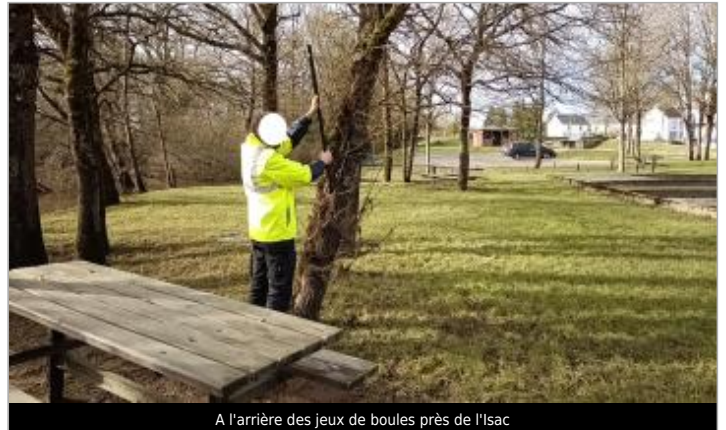
A l'arrière des jeux de boules près de l'Isac

Coordonnées WGS84 : X: -2.04504717 / Y: 47.57084030