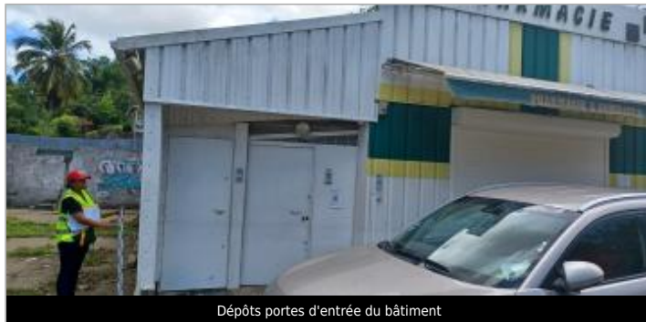
Dépôts portes d'entrée du bâtiment