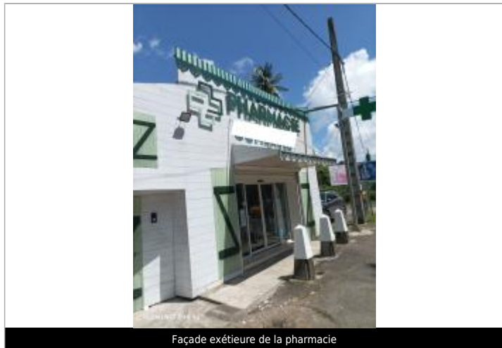
Façade extérieure de la pharmacie

Différence entre le niveau d'eau et la référence (en m) : 0.670 m