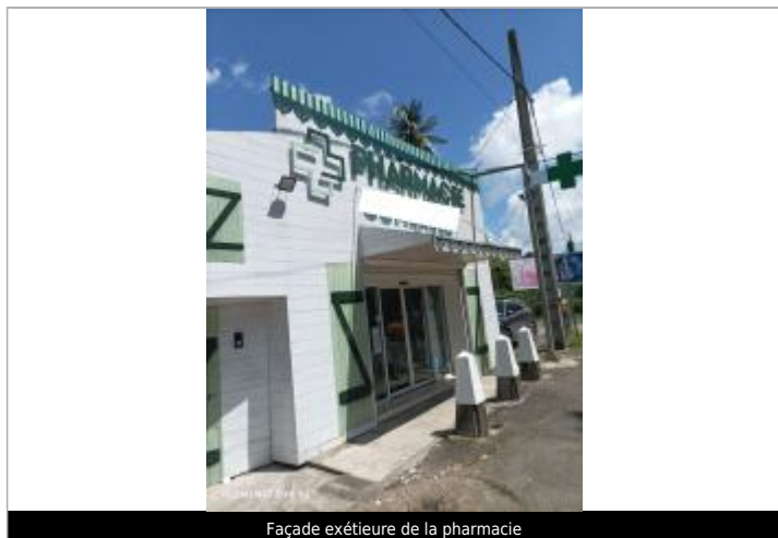
Façade extérieure de la pharmacie

Différence entre le niveau d'eau et la référence (en m) : 0.670 m