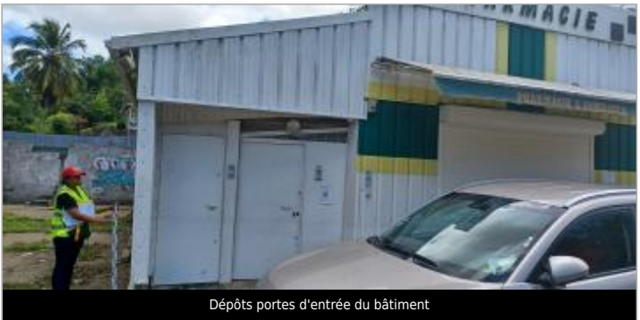
Dépôts portes d'entrée du bâtiment