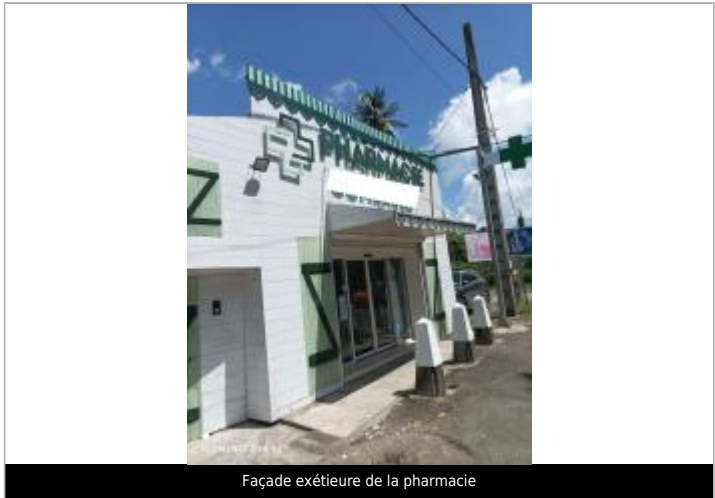
Façade extérieure de la pharmacie